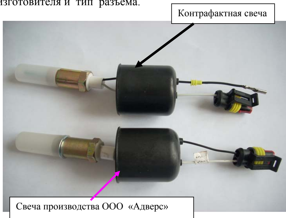
Фото. 2- Свечи

5) разъем у контрафактной свечи изготовлен кустарно и не отвечает требованиям предъявляемые к разъему, т.е. негерметичен, контакты развернуты относительно ответных контактов и т.д, что приведет при присоединении к фирменному разъему к плохому контакту и поломке разъема. Фирменный разъем имеет на поверхности маркировку изготовителя и тип разъема.